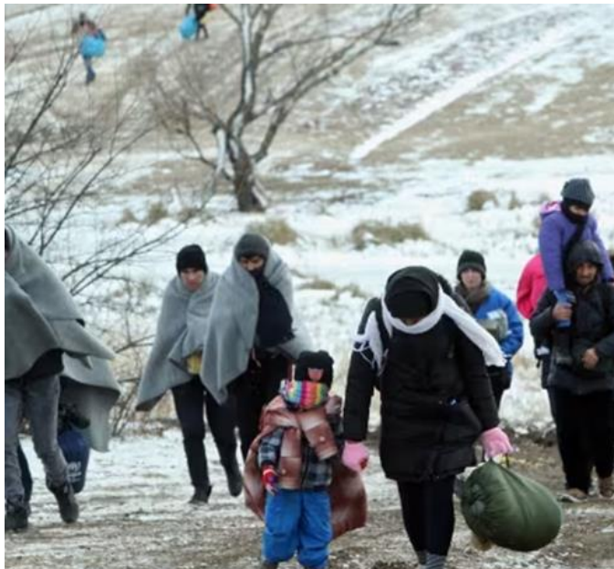
Ukrainalaisia pakolaisia pakenemassa sotatoimialueelta

Вже більше, як півтора року, як наша Україна страждає від війни. Вже більше, як півтора року,, як ми, схопивши своїх дітей втекли від війни, від завивання сирен, від вибухів і смерті, яку поширює раша на нашій території. Дякуємо Фінляндії, що надала нам прихисток. Ми тут в безпеці. Але протягом цього часу наші серця обливаються кров'ю і сльозами, адже в нашій країні триває війна.