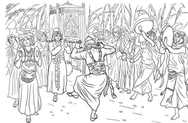
Daavid ja koko israelin heimo karkeloi

Daavid otti useampia vaimoja ja hänelle syntyi vielä poikia ja tyttäriä. Voi sitä hääjuhlien määrää ja humua! Lasten syntymisen iloa, mutta myös anoppeja joka lähtöön. Filistealaiset oli juuri voitettu ja Daavid päättää tuoda liiton arkin Jerusalemiin, jolloin ”Daavid ja koko Israelin