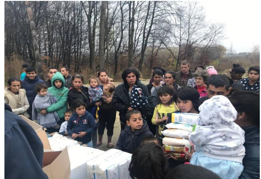
Ukrainalaisia pakolaisia hakemassa avustusta