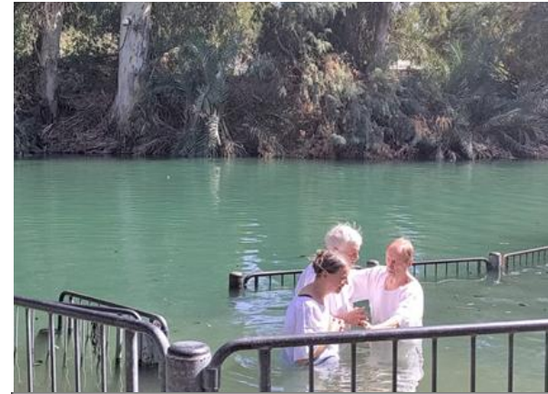
Kastetilaisuus Jordanin virrassa

Jordanvirrassa. Vierailimme myös Samarian alueella ja rukoilimme sen alueen puolesta. Kaikki voimallisia ja unohtumattomia kokemuksia. Myös käynti Kuolleellamerellä oli unohtumaton kokemus.