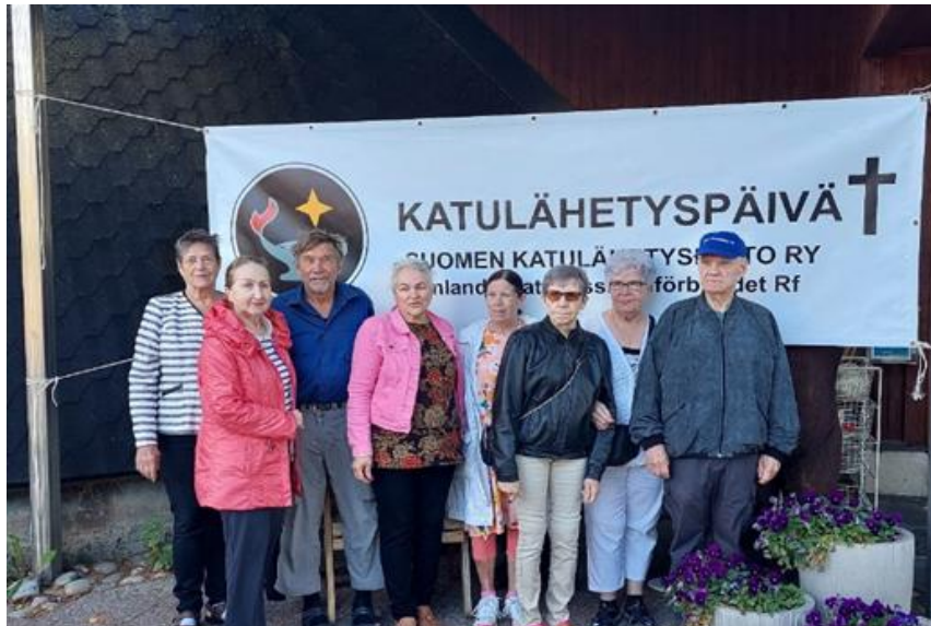
Turun Katulähetysliiton kesäpäiville osallistujat