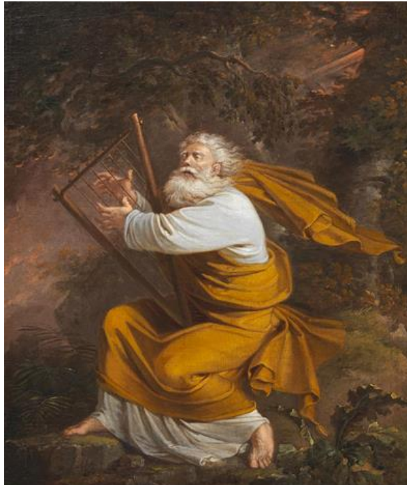
Daavid rukous: Älä heitä minua pois kasvojesi edestä

Daavid – mies, joka rukoili: ”Älä heitä minua pois kasvojesi edestä, äläkä ota minulta pois Pyhää Henkeäsi.” (Ps. 51:13) sai elää tunteiden koko kirjon ja kulkea koko virran matkan meille rohkaisuksi. Miten me löytäisimme siunauksen virran? Raamattu lupaa: ”Antakaa, niin teille annetaan. Hyvä mitta, sullottu, pudistettu ja kukkurainen, annetaan teidän helmaanne; sillä millä mitalla te mittaatte, sillä mitataan teille