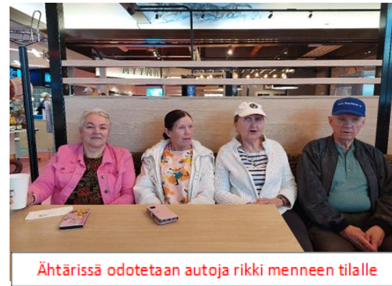
Ähtärissä odotetaan autoja rikki menneen tilalle