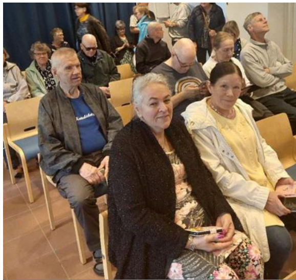
Liiton kesäpäiville osallistujia