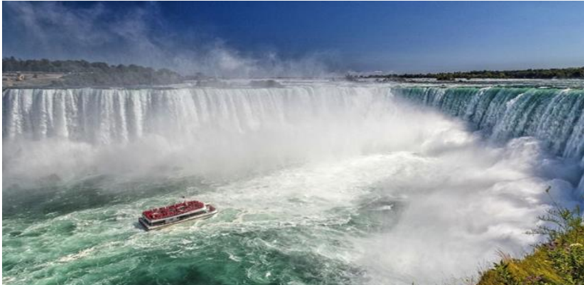
Virta vie Niagarin putouksilla turistilaivaakin

Voisimme kuvitella elämää ikään kuin lastuna, jota virta kuljettaa väijäämättömästi eteenpäin – välillä nopeammin ja välillä hitaammin, su-