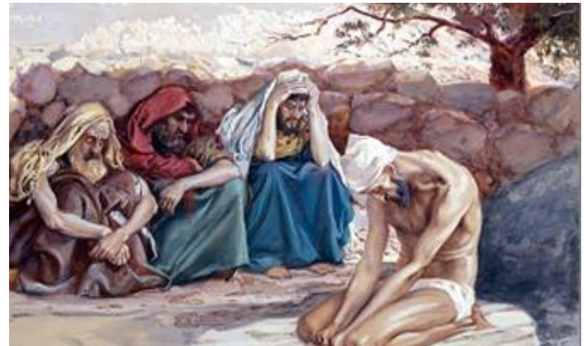
Job rukoilee ystäviensä puolesta

rukousvastaukset eivät helmiä heti ja helpolla. Itse olen miettinyt sitäkin koulua, joka oli Jobilla. Hän oli hurskas (Herra ja kertoja totesivat sen alkuluvuissa useaan kertaan), mutta hän ei siinä koetuksen tilassa varmaankaan kokenut yhtään rukousvastausta Herralta. Päinvastoin Herran kasvot olivat pimentyneet hänelle, ja hän jopa koki Herran vihollisenaan. Mutta kun koetus oli ohi ja Job rukoili kuuliaisena ystäviensä puolesta, Herra jälleen vastasi (Job 42:10. Herra